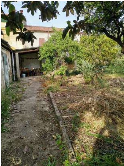
Possibile "Tettoia Pinardi" sarda.