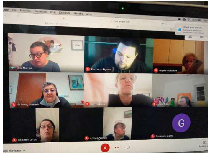
Formazione con ZOOM e incontri di Consiglio